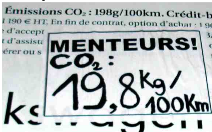
Panneaux publicitaires, route de la Charité à Saint Germain du Puy

La voiture propre n'existe pas. Même avec la moins polluante, la Lupo par exemple, pour 2,5kg de carburant mis dans le réservoir on libère 8kg de CO 2 ... Alors que faire pour sauvegarder la vie sur Terre?