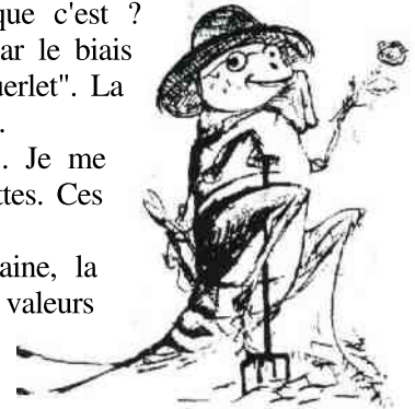
Le grillon jardinier. Guerlet, grillon en Berrichon.